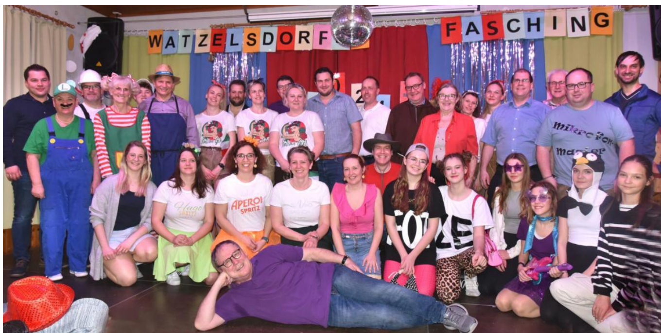
Die Faschingsgruppe freut sich auf Ihren Besuch!